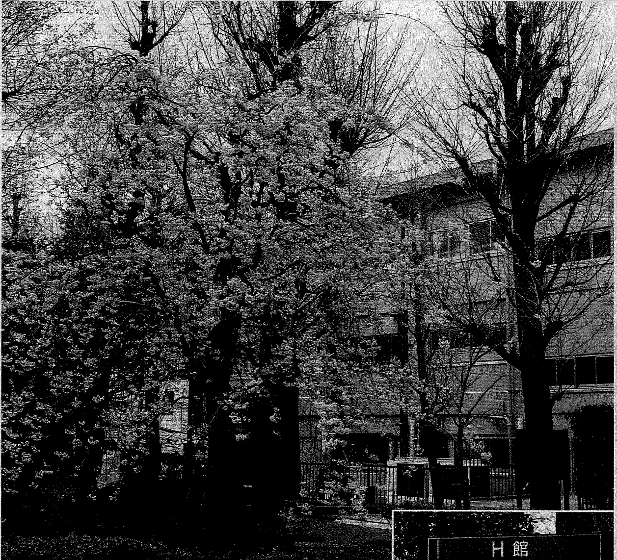
文京キャンパスH館